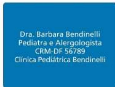
Cartela para filme